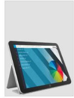
Matematika 7 i-gradivo

Koda: DZ 1.del ali pošlješ sporočilo, da ti pošljem novo kodo.