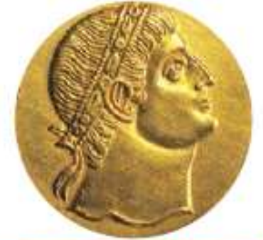
CESAR KONSTANTIN (272–337)

Krščanstvo je s svojimi nauku neopazno spreminjalo rimsko družbo, saj je postavilo nove družbene vrednote.