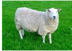
OV C A